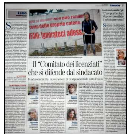
Immagine: articolo apparso sul quotidiano 'la Stampa' del 30 gennaio 2011